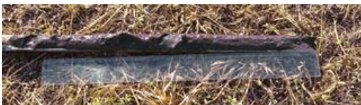
ボーリングコア コア全景 黒色の粘土層が見られる