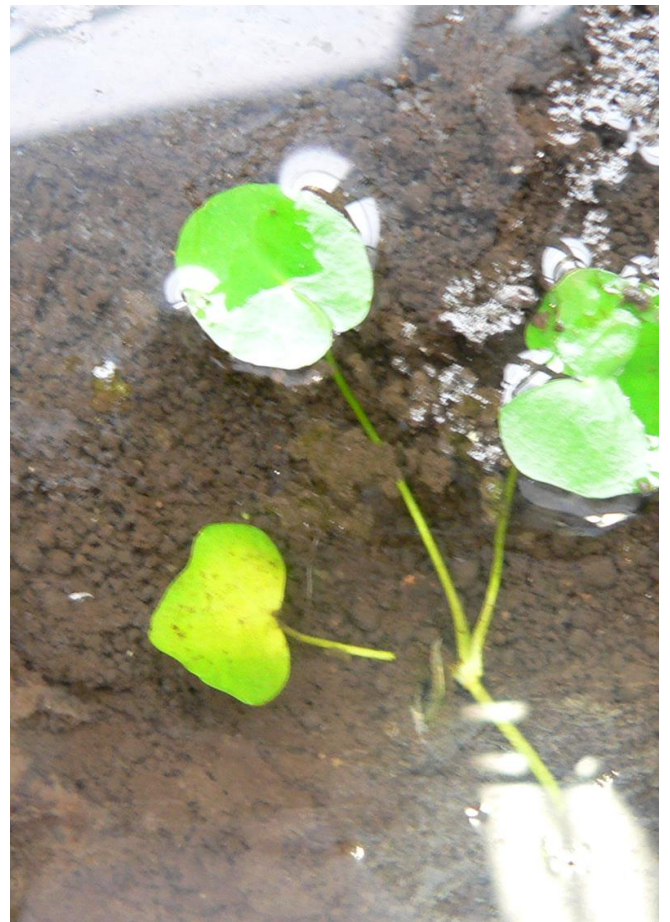
種子が発芽したもの