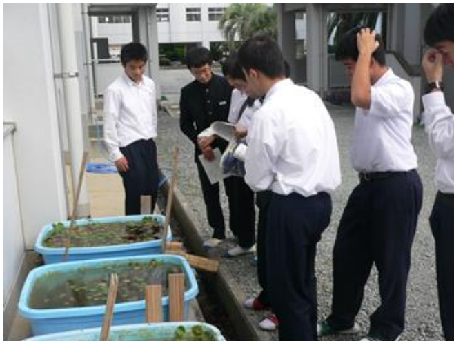
本校理科室横での系統栽培

解析結果は、表層より13cmに褐色～淡褐色・2～3mmの垂角礫～角礫を含む礫が見られた。その下部にあたる深度20cmには茶色～黒色～黒灰色の粘土層が見られ、記載岩石学的にも従来の知見と相違ないことから有明粘土層と推定した。