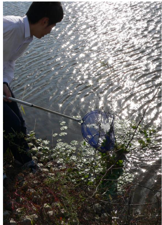
筑後市下北島に自然に生息しているアサザ 定期的に清掃活動しています