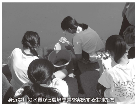
身近な川の水质から環境問題を実感する生徒たち