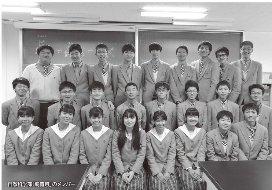
自然科学部「飼育班」のメンバー

そのため活動の幅は広く、たとえば透明骨格標本を作る「骨班」や、カビからペニシリンの抽出を試みる「メディスン班」、「発酵班」や「天文班」など、さまざまな班が各々の研究テーマに取り組んでいる。