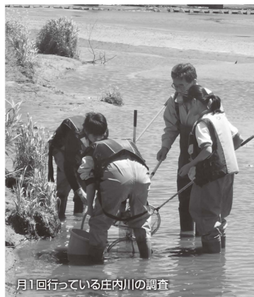
月1回行っている庄内川の調査